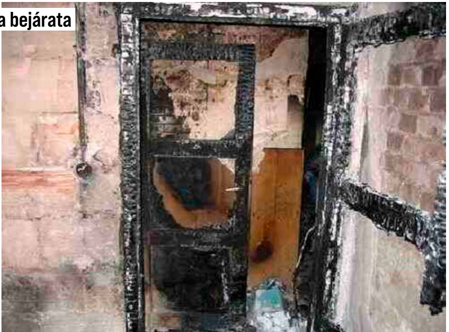
...és a bejárata