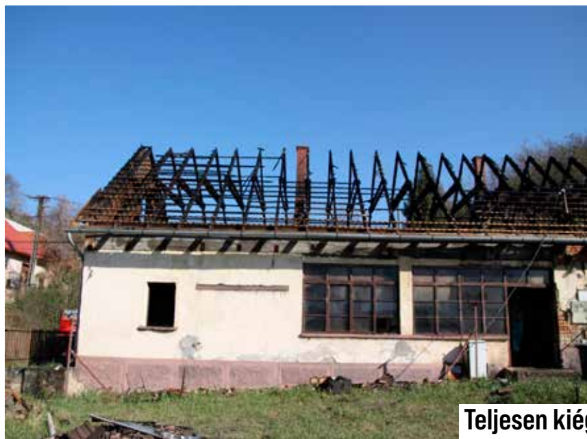
Teljesen kiégett és leégett lakóépület