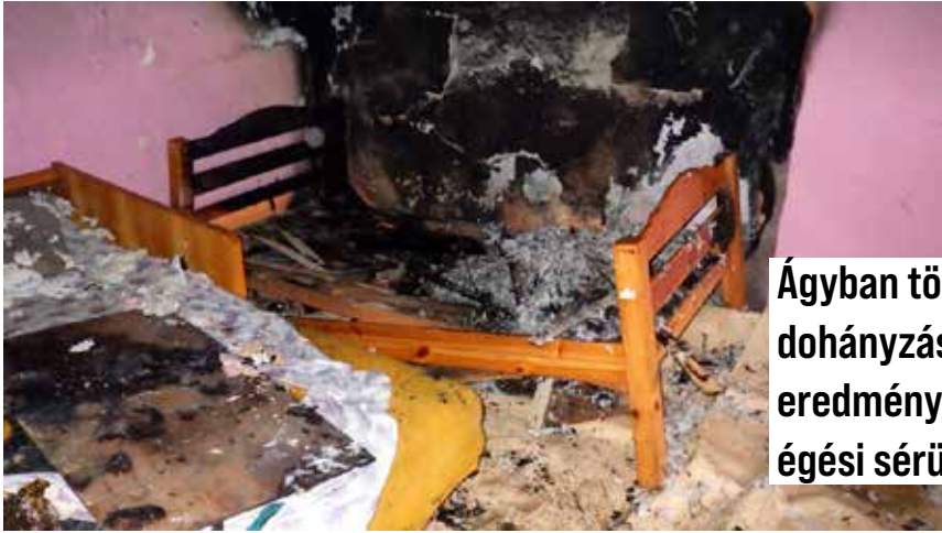
Ágyban történt dohányzás eredménye 2 fő égési sérülttel